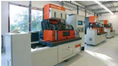
Unser Erodierzentrum, High End Maschinen von Chamilles und unser Know-How garantieren höchste Präzision und Qualität.