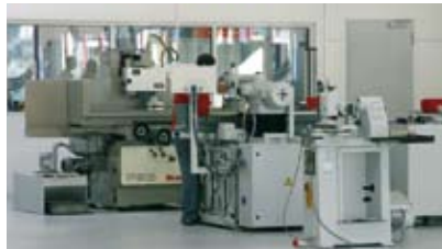
Ein Bildausschnitt aus der Werkstatt unseres Formen- und Werkzeugbaus, Bereich Flachsleifen.