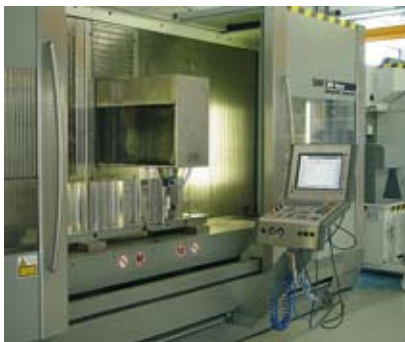
Zur Herstellung von Schmiedegesesenken verfügen wir über zwei DMG Fahrständermaschinen mit 3m Arbeitstischen.