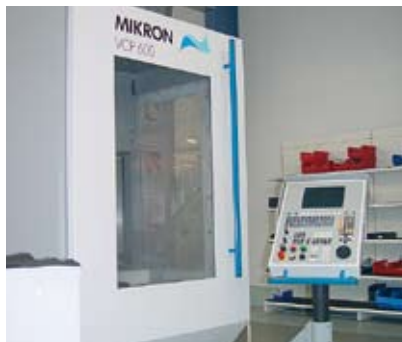
Die ideale Ergänzung zur schnellen und flexiblen Bearbeitung von kleineren und mittleren Frästeilen.