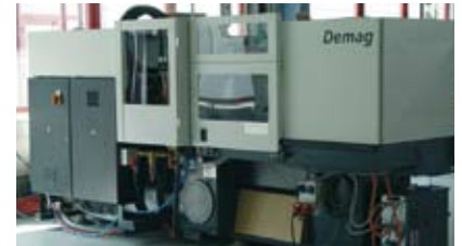
Mit eigenen Spritzgießmaschinen realisieren wir Abmusterungen von Neuwerkzeugen und Lohnaufträge im Spritzgießen.